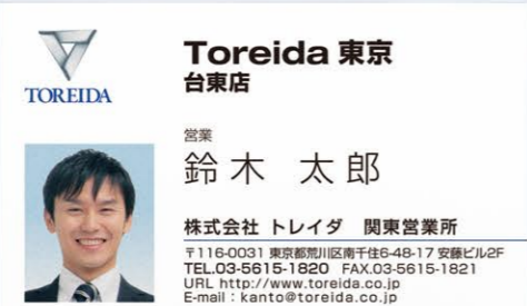
マシュマロホワイト180kg