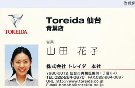
マシュマロナチュラル160kg