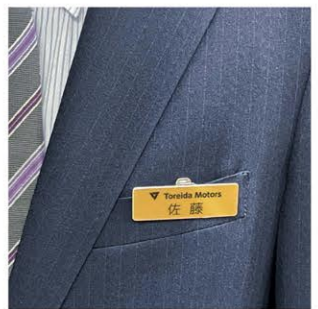
※写真はD2920-05の使用イメージです。