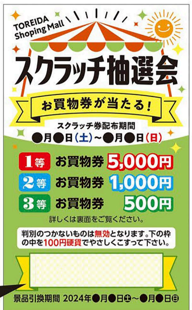
表面スクラッチ面イメージ

詳細イベント内容や注意書きを入れられます。 スクラッチカードのお返しについて 2024年●月●日～●月●日 お買物券が当たる! スクラッチ券配布期間 ●月●日(土)～●月●日(日) 1等 お買物券 5,000円 2等 お買物券 1,000円 3等 お買物券 500円 景品引換期間 2024年●月●日～●月●日