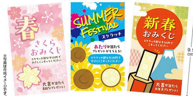
※写真は作成イメージです。

片面印刷：フルカラー その場でこすって“あたり”が出たらプレゼント! などシンプルな内容のくじ用に